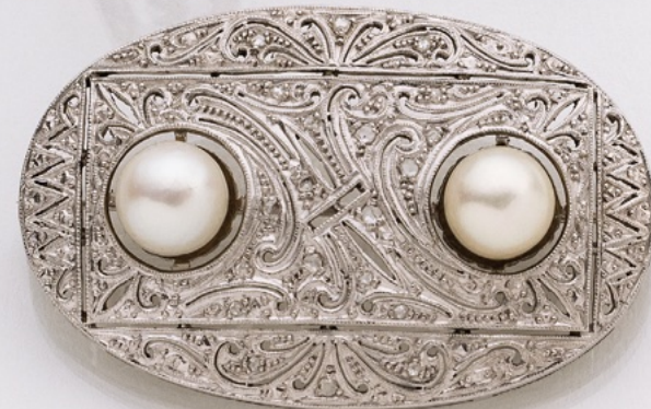
51. Brosche Pt/14K. Diamanten 0.08 ct. € 3.400,-