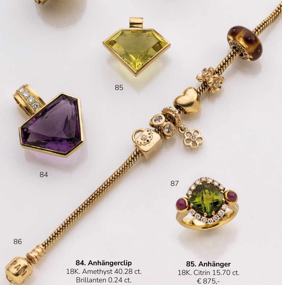
84. Anhängerclip 18K. Amethyst 40.28 ct. Brillanten 0.24 ct. € 1.350,-