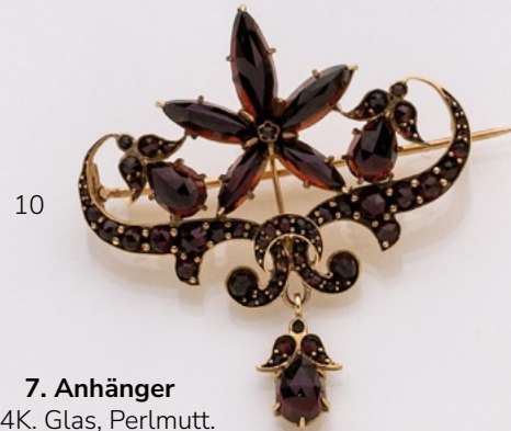
10. Brosche 14K. Granate. € 850,-