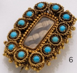
4. Brosche mit Medaillonfunktion 18K/14K. Rubine 1.43 ct, Saphir 1 ct, Diamanten 0.80 ct. € 3.500,-