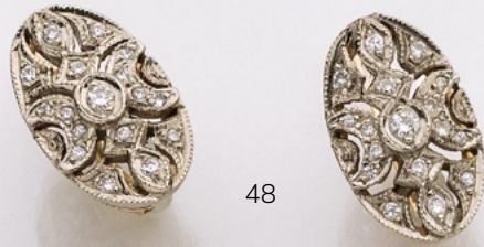
48. Ohrhänger 14K. Brillanten 0.40 ct. € 1.100,-