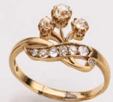
11. Ring 14K. Diamanten 0.75 ct. € 1.650,-