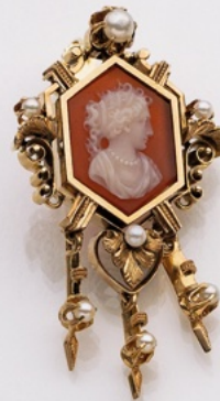
12. Medaillon 18K. € 3.400,-