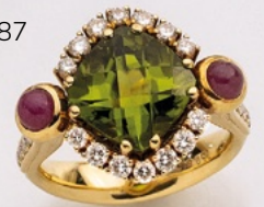
87. Ring 18K. Peridot 6 ct, Rubine 1 ct, Brillanten 0.72 ct. € 2.300,-