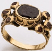
5. Ring 18K. Granat. € 1.100,-