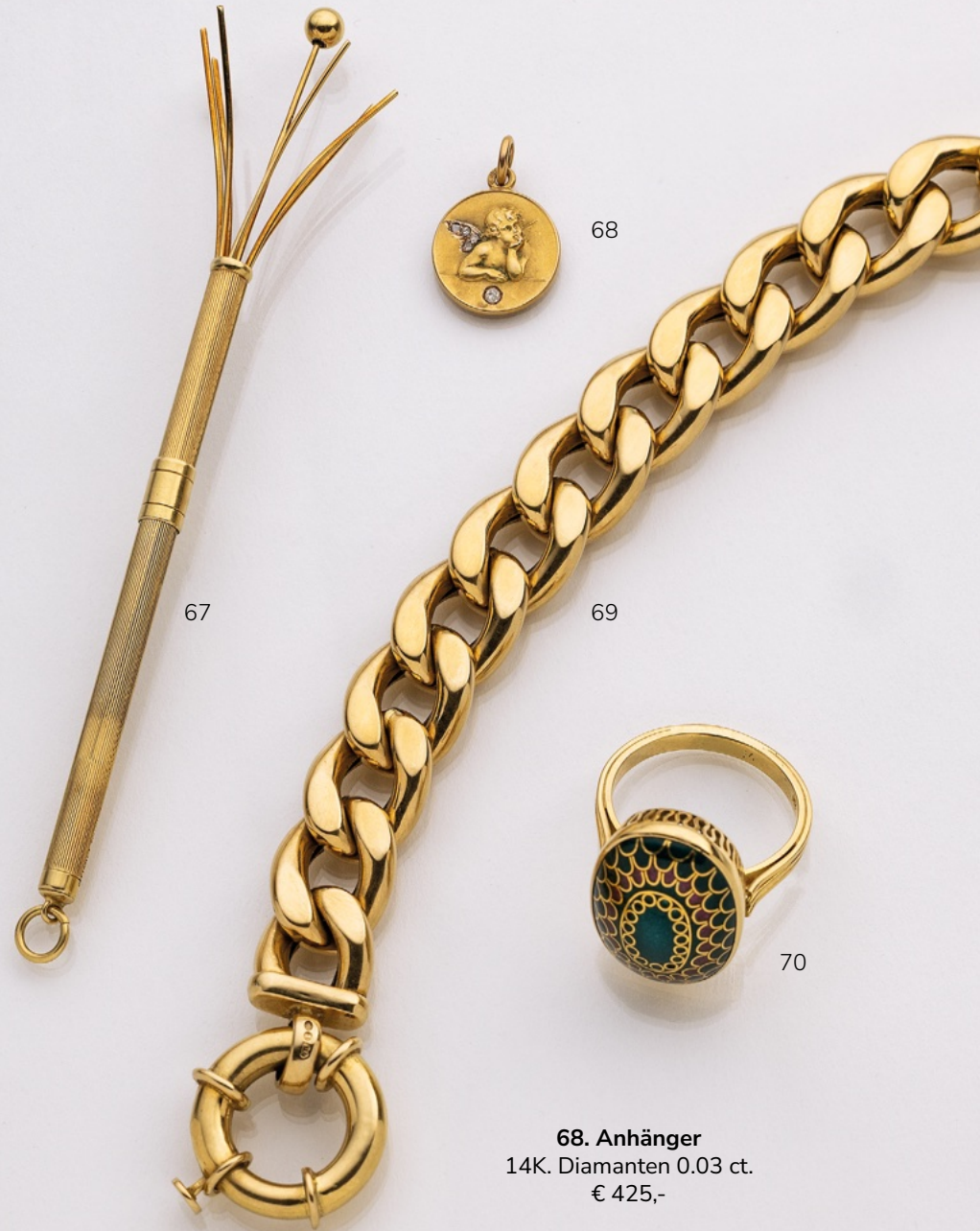
67. Champagner-/Sektquirl 18K. € 1.800,-