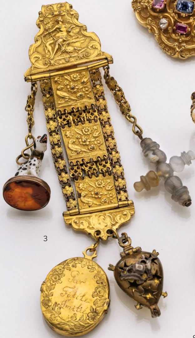
3. Rockstecker/Chatelaine 14K/vergoldet/Kupfer. Email, Achat, Karneol. € 1.750,-