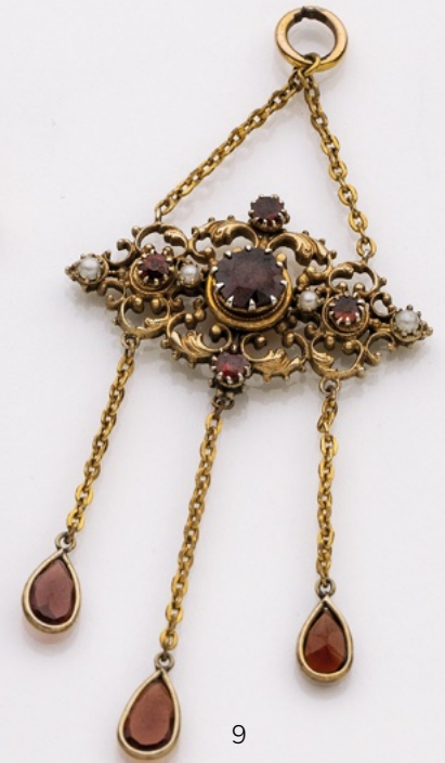
9. Anhänger Ag/vergoldet. Perlchen, Granat. € 110,-