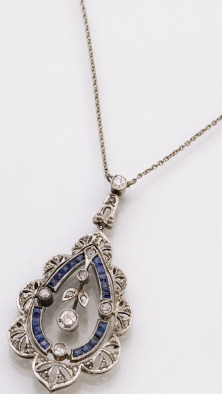
50. Collier 18K/Pt. Saphire 0.38 ct, Diamanten 0.34 ct. € 1.550,-