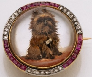
44. Essex-Kristall-Brosche 18K. Diamanten 0.12 ct, Rubine 0.48 ct, Bergkristall, Malerei, Perlmutter. € 4.500,-