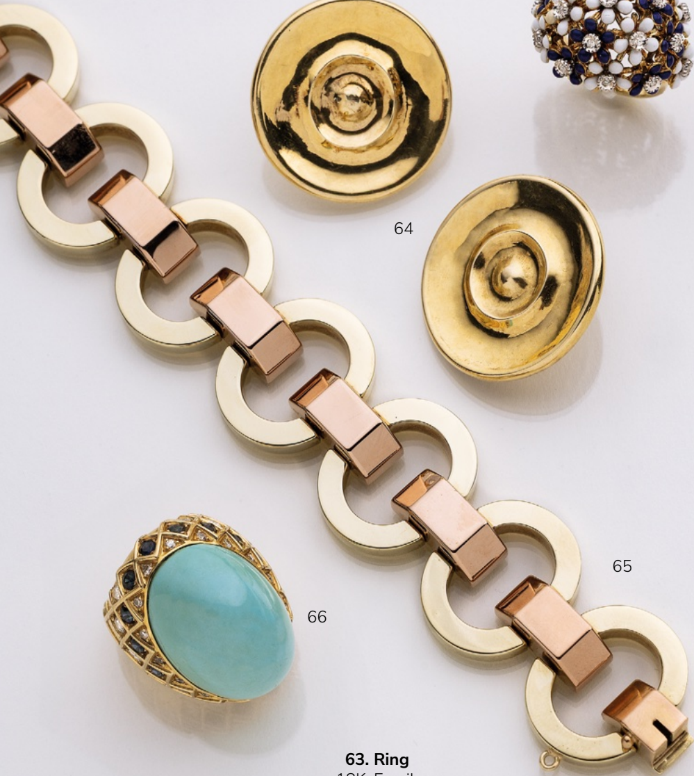
64. Ohrstecker 14K/18K. € 3.100,-