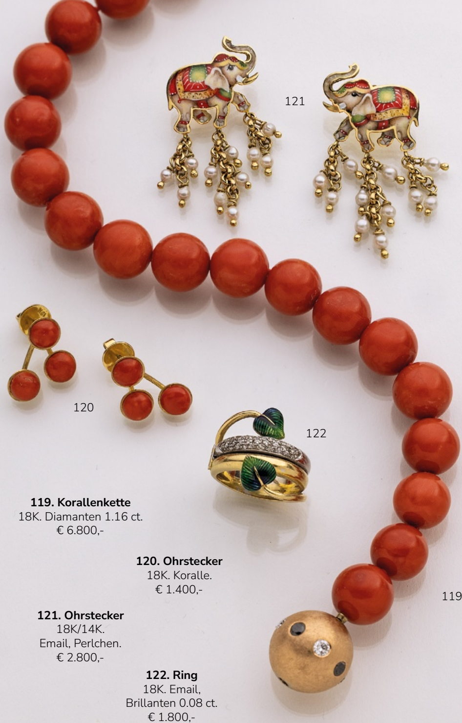
119. Korallenkette 18K. Diamanten 1.16 ct. € 6.800,-