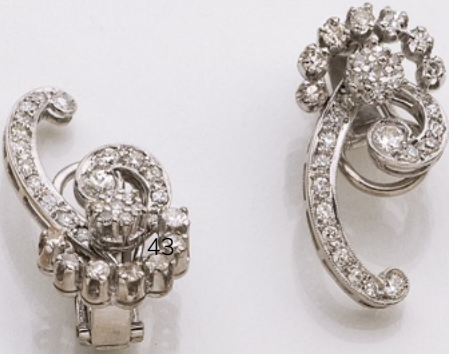
43. Ohrclips Pt/14K. Diamanten 1.14 ct. € 3.650,-