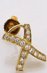
98. Collier Tiffany & Co., Elsa Peretti. 18K. Brillanten 0.61 ct. € 1.950,-