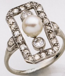
49. Ring 14K/Ag. Perle, Diamanten 0.70 ct. € 1.100,-