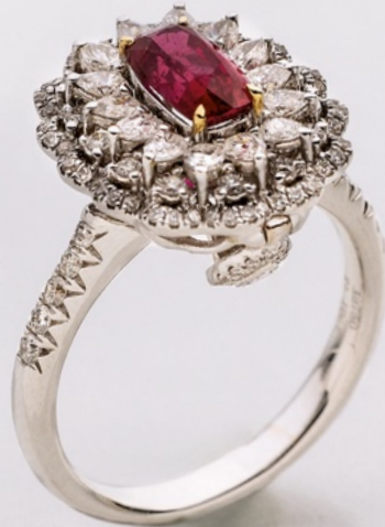
161. Ring Vera Wang. 14K. Diamanten 1 ct. € 2.100,-