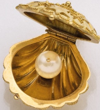
101. Möwen-Brosche Tiffany & Co. 18K. € 1.350,-