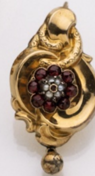
7. Anhänger 14K. Glas, Perlmutter. € 450,-